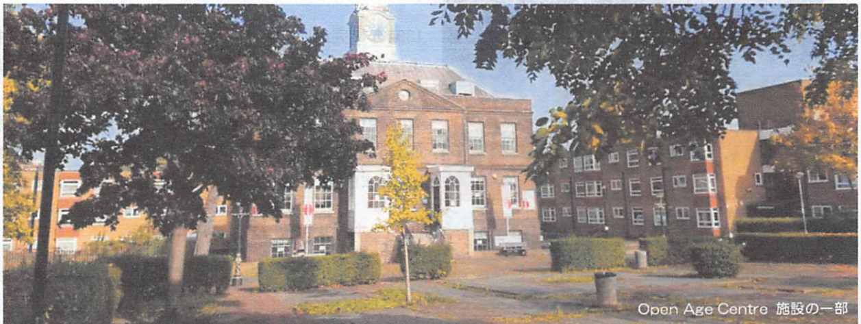
Open Age Centre 施設の一部

アクティビティには、ダンス、ヨガ、椅子のエクササイズ、ウォーキンググループなどの健康とフィットネスのクラスから、舞台芸術のセッションまで、あらゆるものが含まれており、この度のボディパーカッションの活動支援はオープン・エージセンターの目的とするものと共通し、ボディパーカッションの研修の一環として実施されます。