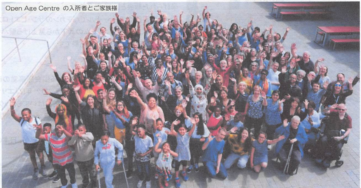
Open Age Centre の入所者とご家族様