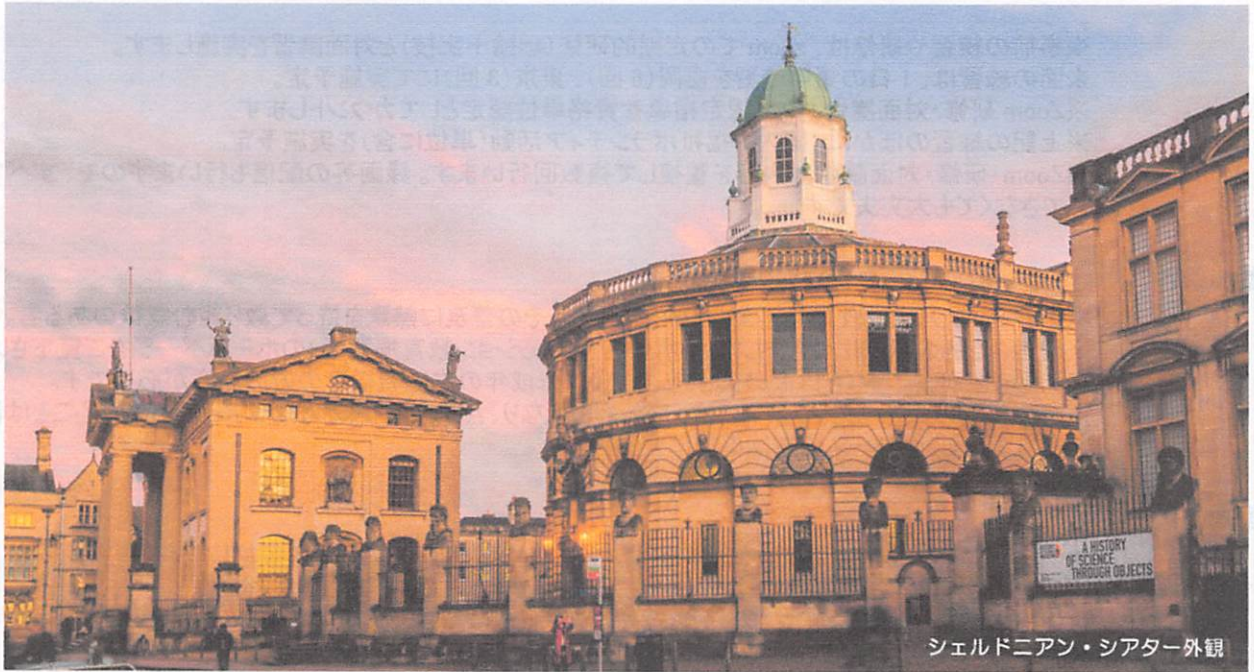
シェルドニアン・シアター外観

この度、2023年3月23日(木)「予定」にオックスフォード大学の特別なお計らいによりボディパーカッションの発表の場として提供して頂ける運びとなりました。