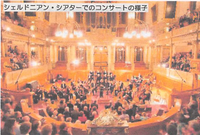
シェルドニアン・シアターでのコンサートの様子