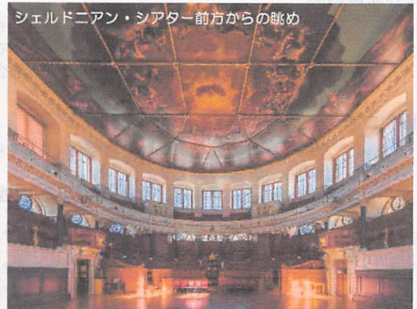
シェルドニアン・シアター前方からの眺め